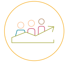
D. Berufliche Weiterbildung