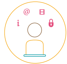
H. Digitale Kompetenz der Schülerschaft