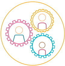
E. Pädagogik: Unterstützungen und Ressourcen