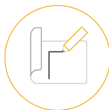
G. Novērtēšanas prakse