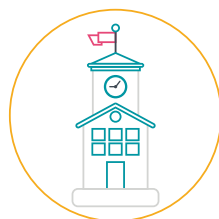
C. Infrastruktūra un aprīkojums