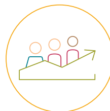
D. Profesionālās Kvalifikācijas Celšana