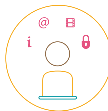
H. Skolēnu digitālā kompetence