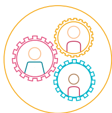
E. Pedagoģija: atbalsts un resursi