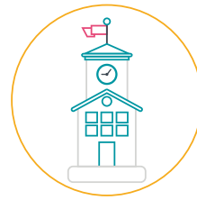
C. Infrastructură și echipamente