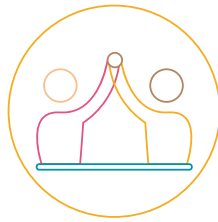
B. Colaboratori și membrii ai rețelei